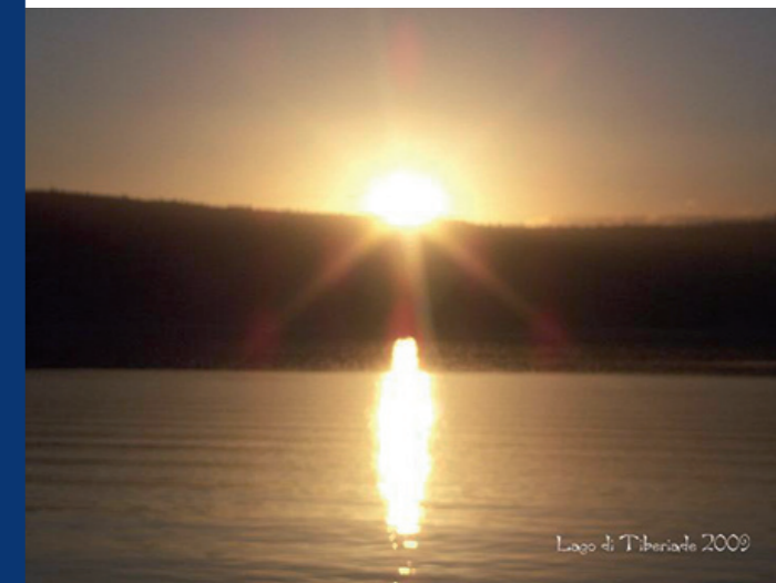
Lago di Tiberiade 2009

Il NODO rappresenta la continuità di un legame d'amore che all'apparenza sembra essersi spezzato ed invece è più unito che mai. E' il simbolo dell'infinito, la rappresentazione della morte quale momento di transizione e di passaggio. Aprire la mente, nutrire l'anima, ampliare i confini e la conoscenza, aiuta la nostra crescita spirituale e fa comprendere quanto amore possiamo ancora distribuire a piene mani poiché questo è l'unico vero senso di ogni vita.