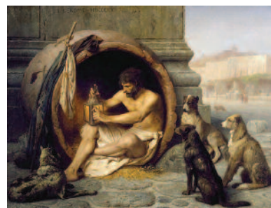
Jean-Léon Gérôme, Diogene , 1860